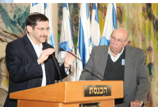
פרס יו"ר הכנסת

פניות הציבור. הלשכה שלנו, כיפק לעידית ולאסי, פועלת רבות לפתרון בעיות של אזרחים הפונים אלינו מול רשויות המדינה. לפעמים מרוב חקיקה וביטחון וכלכלה ואיראן שוכחים שיש אזרח רגיל שזקוק לפתרון בעיה. בשביל זה אנחנו בכנסת.